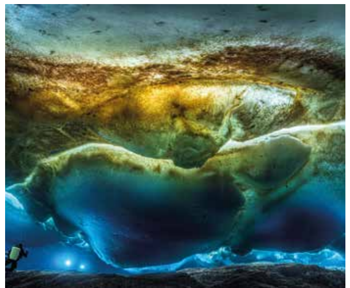
Mers et Mystères, exposition de Laurent Ballesta Musée de la Photographie Charles Nègre - du 5 avril au 28 septembre