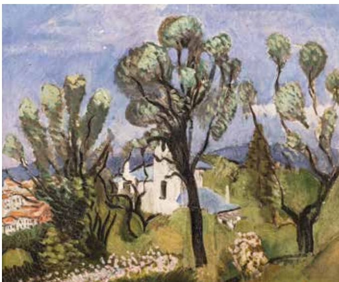
Henri Matisse, la Villa bleue à Nice, 1918, huile sur toile, collection particulière

Palais Lascaris Au temps du grand-maitre Jean-Paul de Lascaris. Nice, Malte et la Méditerranée