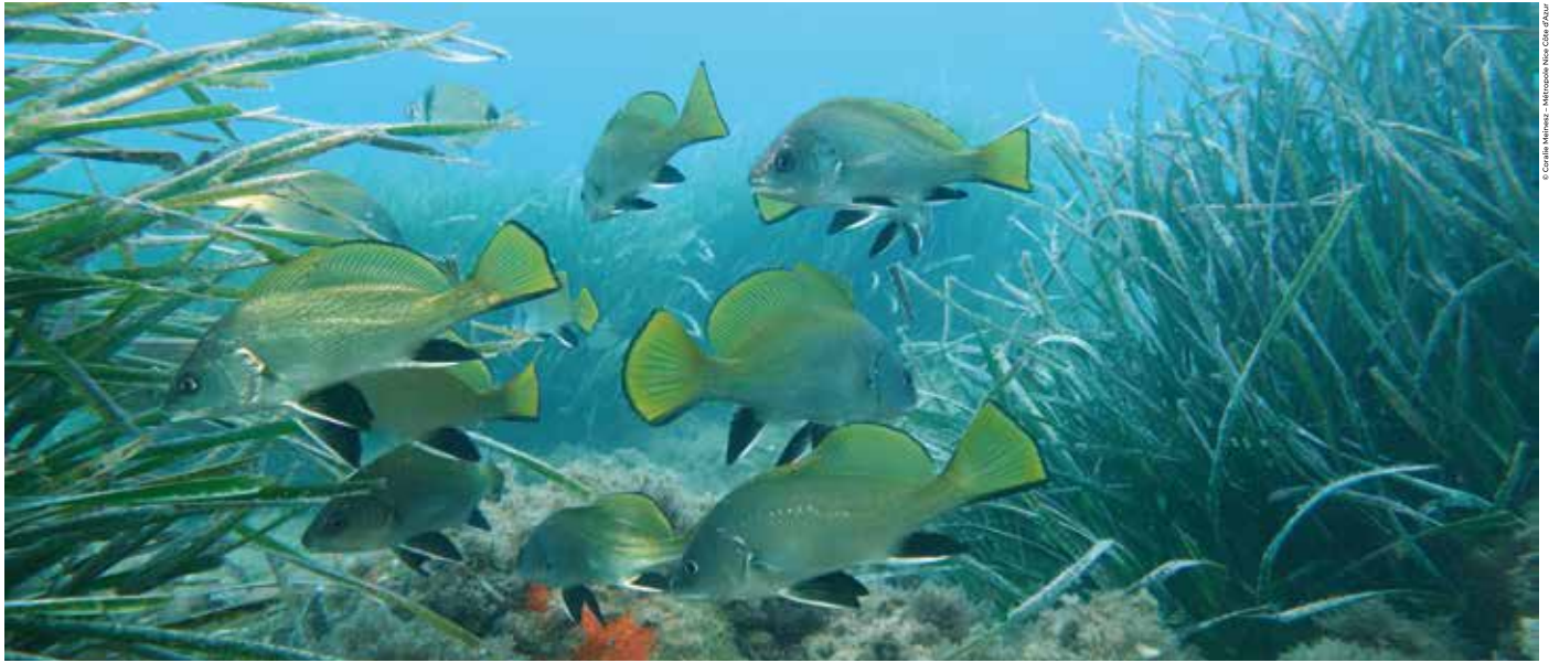
© Corinne Meloni - Méditerranée Nice Côte d'Azur

les organisations de la société civile, les institutions universitaires, la communauté scientifique, le secteur privé, les organisations philanthropiques, les peuples autochtones et les communautés locales, tous ceux qui sont partie prenante de l'avenir de notre planète.